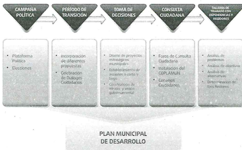
Gráfica 2. METODOLOGÍA PARTICIPATIVA PARA LA PLANEACIÓN