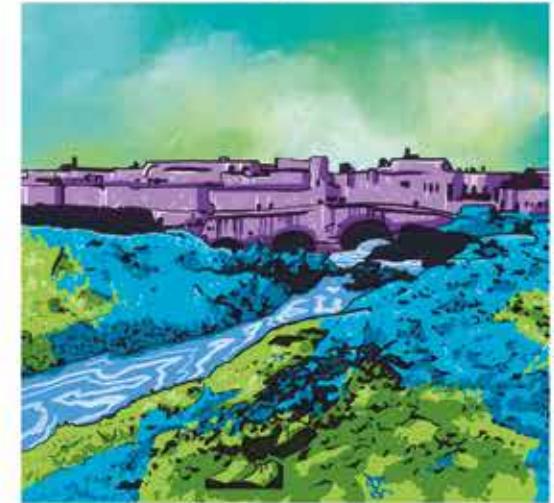
Río San Francisco