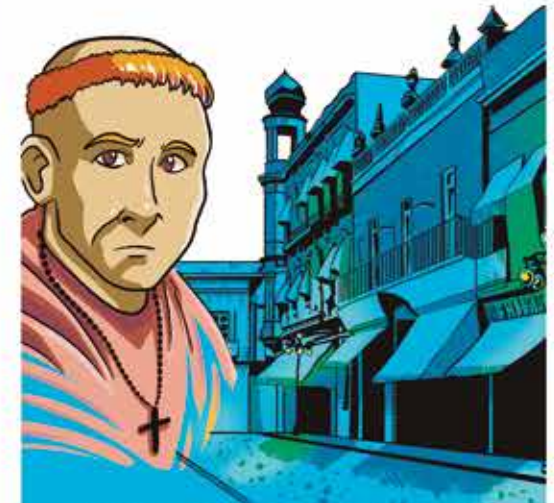
El trazo de las calles de Puebla