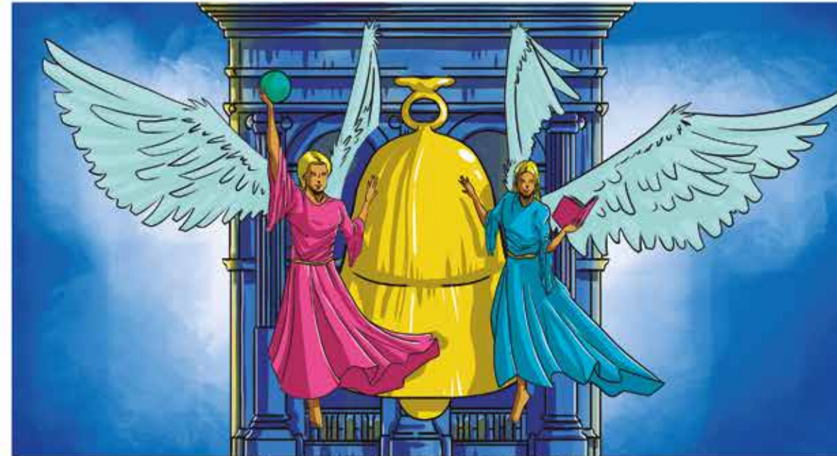
Fundación de la Ciudad de Puebla