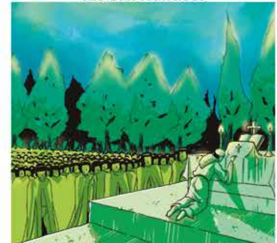
Los primeros vecinos