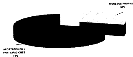
COMPOSICION DE LOS INGRESOS TOTALES 2006 $1,695,917 (miles de pesos)

En lo que se refiere a los impuestos, en 2006 se espera recaudar $234.6 mdp que representan el 46.5% de los ingresos propios. Dentro de los impuestos el predial supone el 68% con $159.1 mdp. Este nivel de ingresos por Impuesto Predial resulta tanto de la actualización en 4.73% de los valores unitarios de construcción y la aproximación en 4.73% de los valores unitarios de suelo a los valores de mercado, tal como lo establece el artículo quinto transitorio de las reformas al artículo 115 Constitucional, así como de la dinámica que ha presentado este rubro de ingreso en el transcurso de 2005, descontando el efecto no recurrente del programa de condonación de multas y recargos. Si bien la condonación masiva fue exitosa al permitir recaudar en niveles históricos tanto impuesto corriente como rezagado, no se puede esperar el mismo nivel de ingresos en 2006 debido a que no habrá descuentos masivos.