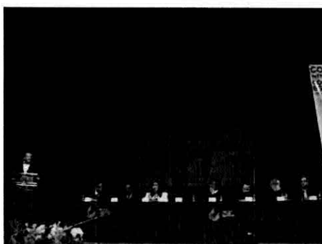
Visitante Distinguido a autoridades de la federación mundial y mexicana de Taekwondo. 27 de Noviembre de 2012