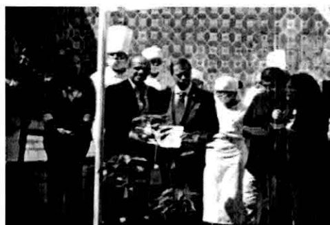
Invitación a la Degustación de Chiles en Nogada por parte de la BUAP y la comisión de Turismo, en el Ex convento de Santa Mónica. 31 de Agosto de 2012