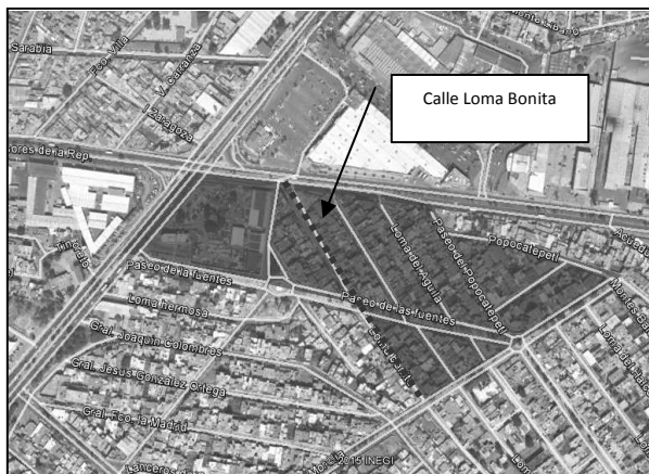
Imagen No. 1. Localización de la Colonia Arboledas Sección Las Fuentes en imagen aérea

Con fundamento en lo dispuesto por los artículos 657 fracción IV del Código Reglamentario para el Municipio de Puebla (COREMUN); y 15 del Reglamento Interior de la Secretaría de Desarrollo Urbano y Sustentabilidad del Honorable Ayuntamiento del Municipio de Puebla, me permito informarle que de conformidad con el análisis documental y cartográfico, se procede a establecer lo siguiente que si es permitido construir condominios de más de tres pisos, dependiendo de la superficie del terreno y tendrá que cumplir con los lineamientos marcados para la densidad de vivienda y coeficientes de ocupación del suelo y de utilización del suelo.